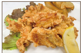
唐揚げ & ポテトフライ