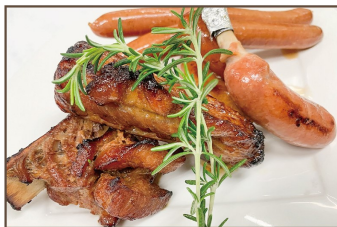
スペアリブ & ソーセージ盛り